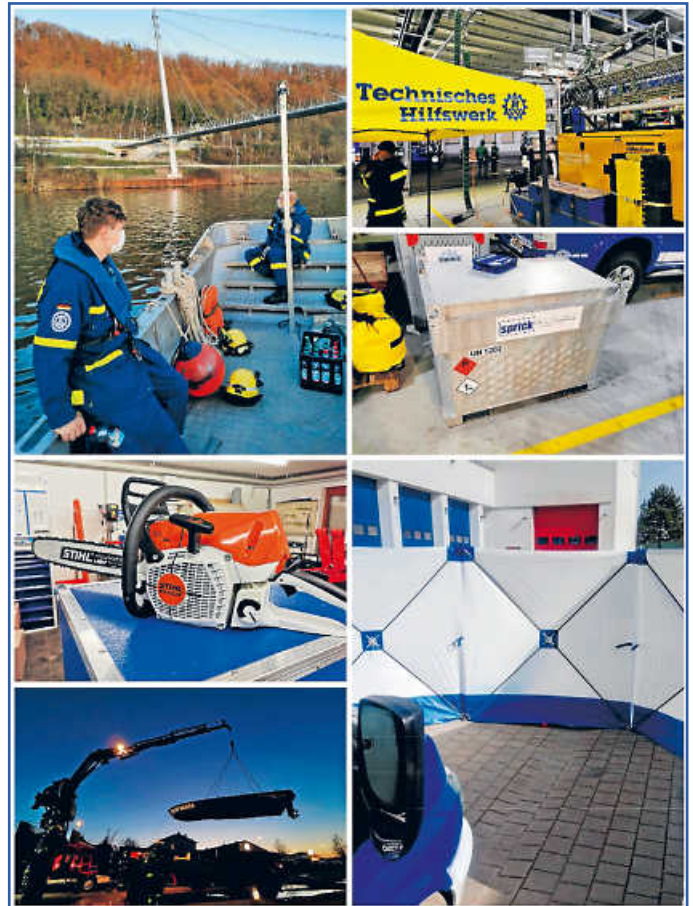
Frühjahresarbeiten beim THW

www.thw-hassmersheim.de und auf Facebook, Instagram sowie Twitter.