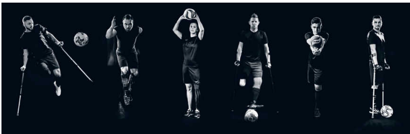
Amputiertensport ist vielseitig - genauso, wie die Schicksale dahinter.