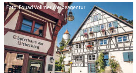
Biberach an der Riß war vor allem für die Weberei bekannt.

www.lokalmatador.de/webcode/vorteil-11923/