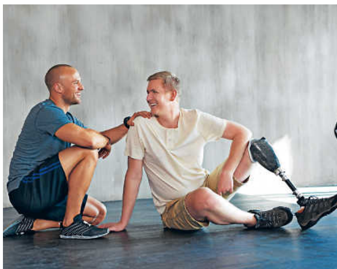
Anpffiff ins Leben unterstützt Menschen mit Amputation. Spenden helfen dabei mit.