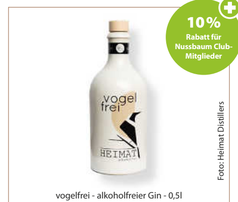
vogelfrei - alkoholfreier Gin - 0,5l

Der Name „Heimat Vogelfrei“ ist neben dem Heimatbezug vor allem ein historisch angelehntes Wortspiel. „Das Wort vogelfrei war früher bezogen auf Menschen, die frei vom Gesetz waren und somit frei von Konventionen oder Normen lebten. Genauso verhält es sich mit unserem Vogelfrei. Als alkoholfreie Spirituose entspricht er nicht unseren alt dahergebrachten Vorstellungen, sondern definiert diese neu, vogelfrei eben. Aber es ist auch ein Wortspiel, vogelfREI von Alkohol“, betont Richter. (haf)