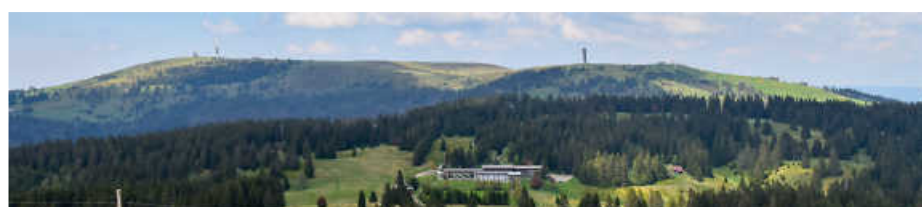
Blick vom Herzogenhorn auf den Feldberg