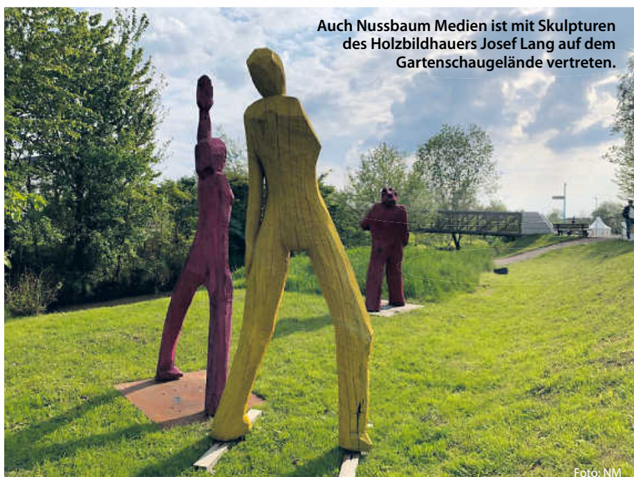
Auch Nussbaum Medien ist mit Skulpturen des Holzbildhauers Josef Lang auf dem Gartenschau-Gelände vertreten.

Auf der groß angelegten Holzterrasse am Stadtweiher entfaltet sich das ganze Spektrum an gärtnerischem Können und floristischer Vielfalt in Kombination mit einem einzigartigen Panoramablick über die historische Altstadt. Ach, und was ganz Besonderes gibt es auch noch: Wer sich in diesem Jahr das Ja-Wort geben möchte, der kann das auch auf der Gartenschau tun. Und zwar passenderweise auf der Liebesinsel, da wo Elsenz und Hilsbach zusammenfließen. Da lohnt sich auch das Ja-Sagen. (jr)