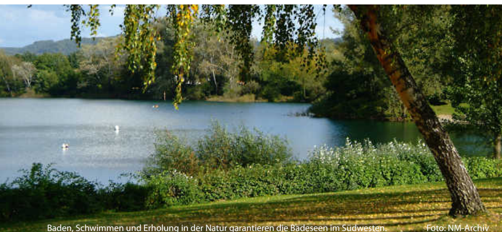
Baden, Schwimmen und Erholung in der Natur garantieren die Badeseen im Südwesten.

Ein Sprung vom 10-Meter-Turm, mit Turbogeschwindigkeit die Wasserrutsche runter oder erste Schwimmversuche im Babybecken – ein Besuch im Freibad heißt Spaß für die ganze Familie. Und auch hier muss man auf gute Wasserqualität nicht verzichten. So badet man beispielsweise im Freibad Neuenbürg in herrlich weichem Quellwasser von hervorragender Qualität. Die walddreiche Umgebung schafft zudem eine ansprechende und natürliche Atmosphäre. (dk/fm)