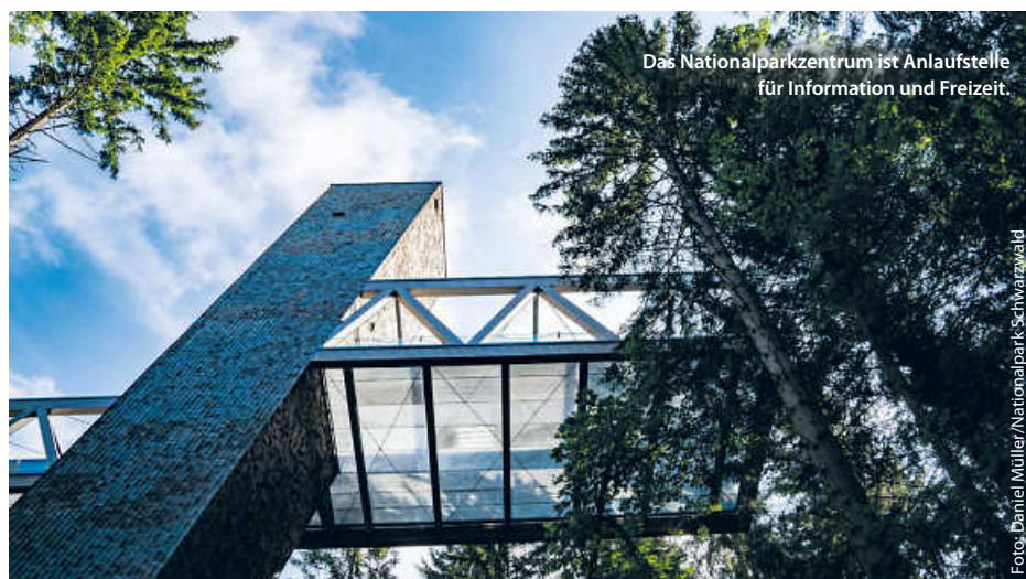
Das Nationalparkzentrum ist Anlaufstelle für Information und Freizeit.

Alles in allem ein echter Grund zum Feiern! „Über das gesamte Jahr wollen wir Bürgerinnen und Bürger bei Führungen und Veranstaltungen dazu einladen, den Nationalpark vor Ort und gemeinsam mit uns zu erleben. Wir wollen genau hinschauen, auf die großen und kleinen, die sichtbaren und verborgenen Veränderungen“, sagt Schlund voll Vorfreude auf ein volles Programm zum Jubiläumsjahr. (pm/red)