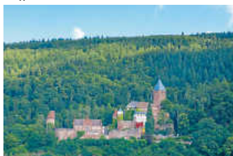
Schloss Zwingenberg im Neckar-Odenwald-Kreis