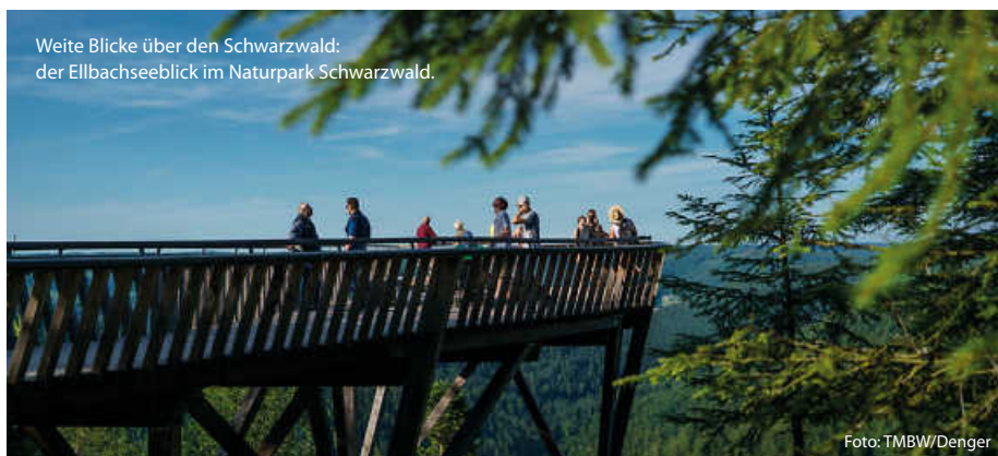
Weite Blicke über den Schwarzwald: der Ellbachseeblick im Naturpark Schwarzwald.

Schon von Weitem ist der Aussichtsturm im Naturpark Schönbuch zu sehen. Die 35 Meter hohe Holz-Stahl-Konstruktion auf dem Stellberg ragt weit über die umliegenden Bäume im ältesten Naturpark Baden-Württembergs hinaus. 348 Stufen erschließen den filigranen Turm und führen zu drei Aussichtsplattformen in 10, 20 und 30 Metern Höhe. Ganz oben kann man nicht nur dem Schönbuch auf sein Blätterdach schauen; auch die Schwäbische Alb und der Schwarzwald erscheinen von hier zum Greifen nah. (TMBW/red)