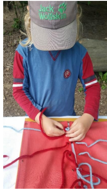
Uns im Schleifen binden üben das macht Spaß