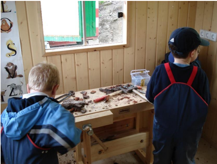
An der Werkbank arbeiten und einen eigenen Kompost bauen, dafür haben wir Hammer, Sägen, Zangen und Nägel