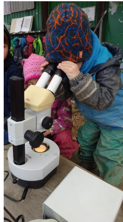
Verschiedene Materialien durch das Mikroskop betrachten