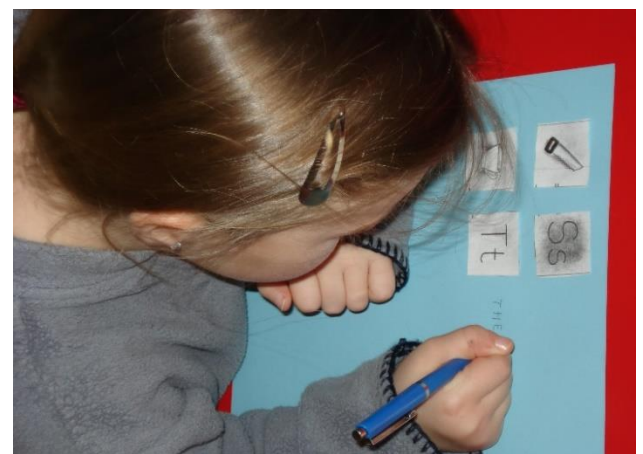
Buchstaben ausschneiden und Bildern zu ordnen - das ist spannend