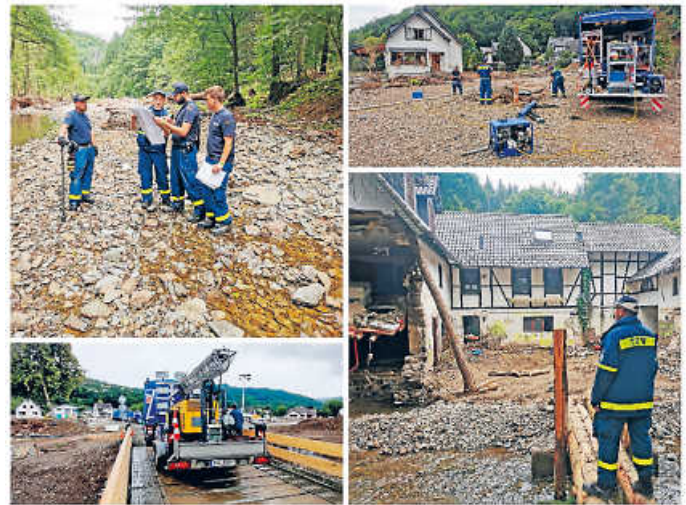
Einsatz Flutkatastrophe Ahrtal

Diese Einsätze können nur gestemmt werden, wenn die Arbeitgeber unsere ehrenamtlichen Einsatzkräfte auch freistellen. Daher an dieser Stelle einen herzlichen Dank an Fibro-Läpple GmbH, Motip Dupli GmbH, Schmitt GmbH Epfenbach, Deutsche Post, Polizei Baden-Württemberg, Audi AG, Berufsfeuerwehr Mannheim, Mann und Schöder GmbH Siegelsbach, Landratsamt Neckar-Odenwald-Kreis und Ingenieurbüro Roth Billigheim für die Freistellung unserer Helfer.