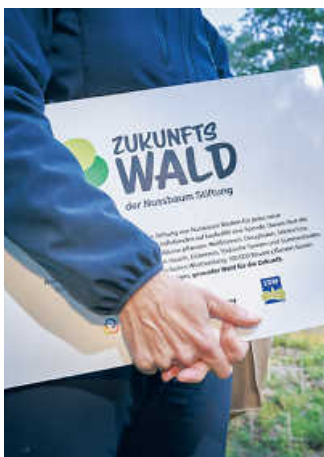
In Eppingen entsteht dank des Engagements der Nussbaum Stiftung ein nachhaltiger „ZukunftsWald“.