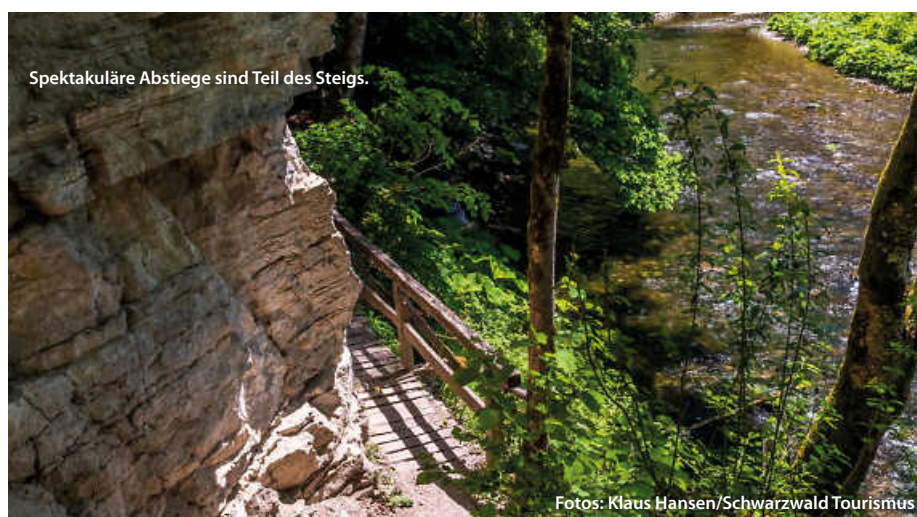
Spektakuläre Abstiege sind Teil des Steigs.

Am Ende macht die Mischung den Reiz des Steigs aus: massive Felswände, enge Pfade, Ursprünglichkeit der Natur, rauschende Flüsse und Wasserfälle, aber ebenso Bergwiesen und imposante Blicke, sowohl in die Ferne (Alpen, Feldberg, Schluchsee) aber auch in die Tiefe der durchwanderten Schluchten. (haf)