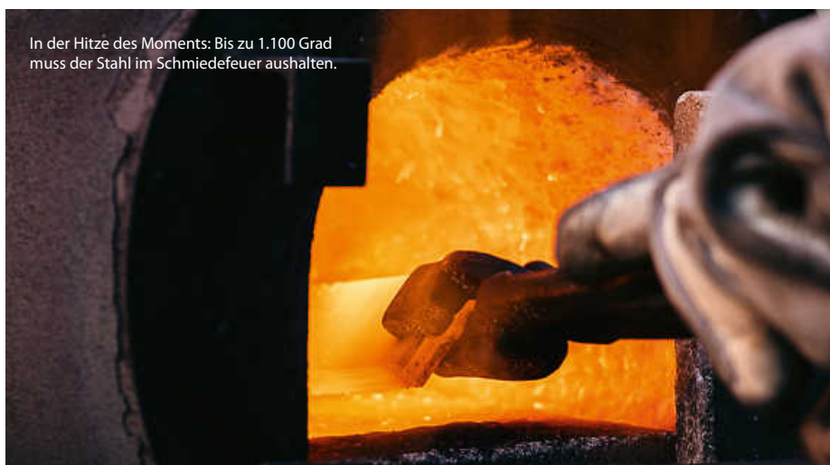
In der Hitze des Moments: Bis zu 1.100 Grad muss der Stahl im Schmiedefeuer aushalten.