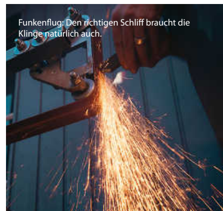
Funkenflug: Den richtigen Schliff braucht die Klinge natürlich auch.

Die Griffe werden je nach Gusto aus Holz oder Kunststoff hergestellt. Für den passenden Klingenschutz aus Leder sorgt auf Wunsch ein Sattler, sollen Griff und Schneideschutz aus demselben Holz sein, hilft ein Schreiner weiter. Individuelle Auftragsarbeiten nimmt Klasen selbstverständlich auch an. Alles Handarbeit, aber das versteht sich irgendwie von selbst ... (es)