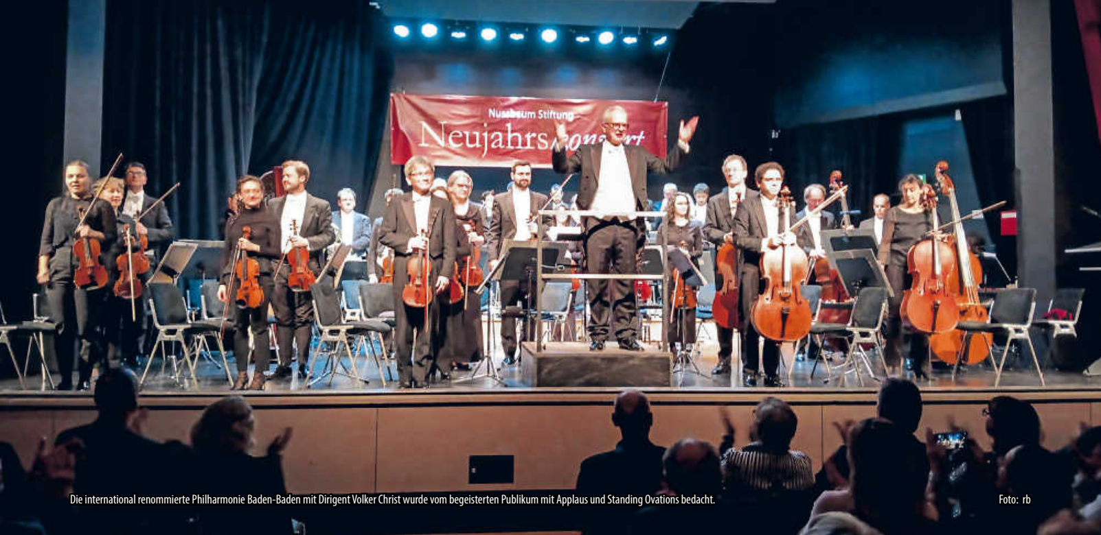
Die international renommierte Philharmonie Baden-Baden mit Dirigent Volker Christ wurde vom begeisterten Publikum mit Applaus und Standing Ovationen bedacht.